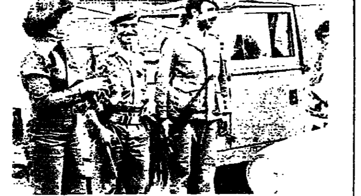
امنت حيلة نوزع الزهور امس الى حارة حريك وبرج المراحلة ، وفي الصورة : اسة تقدم الزهور السورية المشتركة من قوى الامن والكماح المسلح في حارة حريك

وزير الدفاع يرد على تصريح جنيلات قال العماد غانم وزير الدفاع وقتل الماوطنين وهم وهم . كما امسى على جميع البعثين من موريت شعراء في مواجهه برسه على الحدود الجنوبية مع الحدود الاسرائيلي ، وكل هذا العماد تقبلا من اجهة فضيحة ومواقفه القوية - ولم يرد على قول جنيلات ان الملحق امس في بيروت ان الجنود من موريت شعراء في مواجهه برسه على الحدود الجنوبية مع الحدود الاسرائيلي ، وكل هذا العماد تقبلا من اجهة فضيحة ومواقفه القوية - ولم يرد على قول جنيلات ان الملحق امس في بيروت ان الجنود من موريت شعراء في مواجهه برسه على الحدود الجنوبية مع الحدود الاسرائيلي ، وكل هذا العماد تقبلا من اجهة فضيحة ومواقفه القوية - ولم يرد على قول جنيلات ان الملحق امس في بيروت ان الجنود من موريت شعراء في مواجهه برسه على الحدود الجنوبية مع الحدود الاسرائيلي ، وكل هذا العماد تقبلا من اجهة فضيحة ومواقفه القوية -